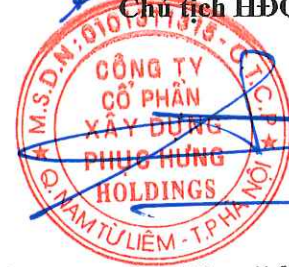
Cao Tùng Lâm